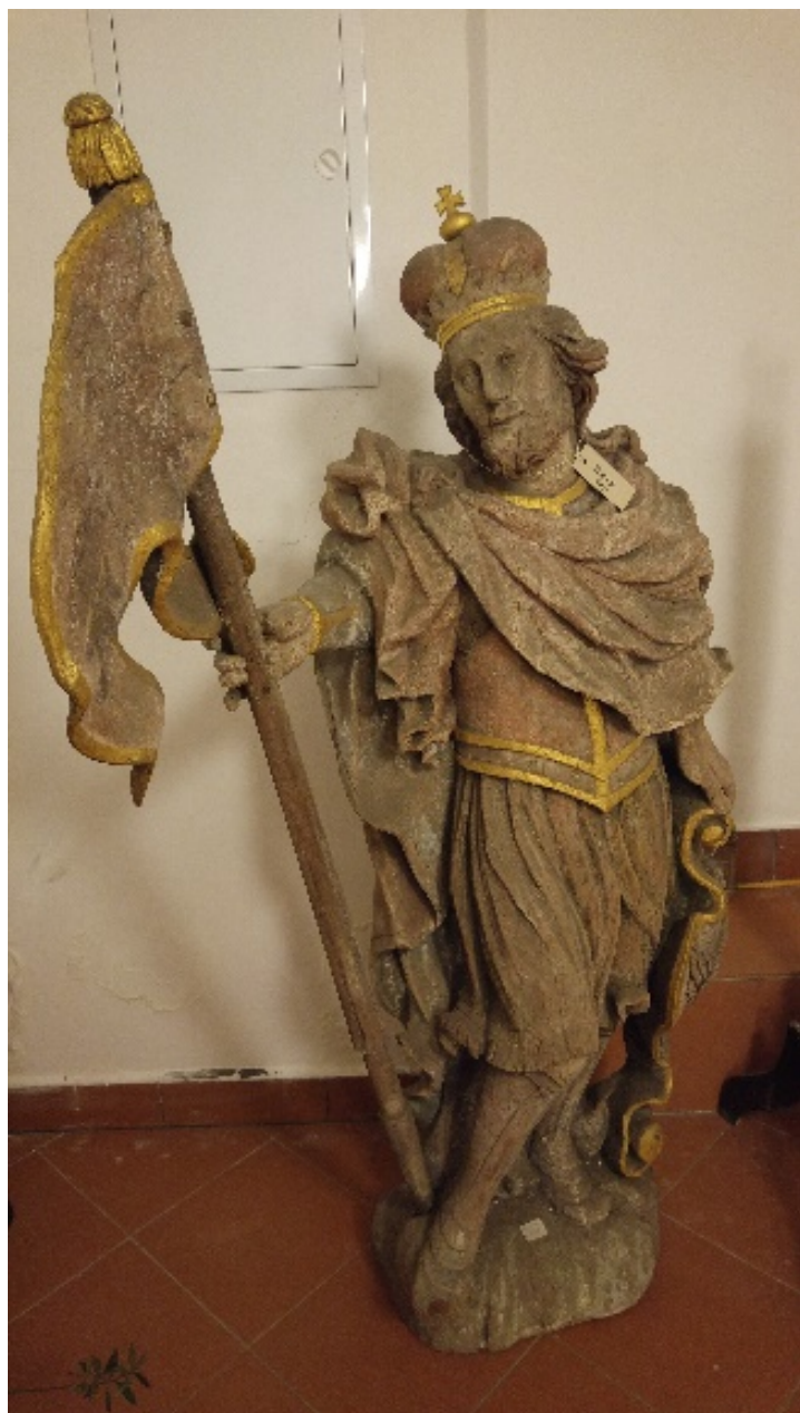
Sv. Václav, Mělník